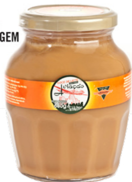
Doce de leite Aviação