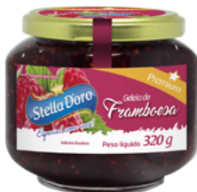
Geleia Stella D'Oro