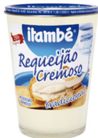
Copo requeijão Itambé