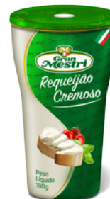
Copo Requeijão Gran Mestri