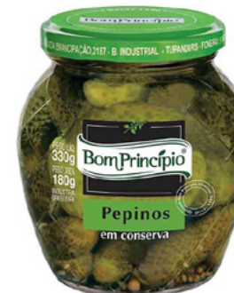
Pote conserva Bom Princípio