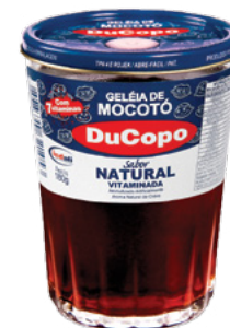
Geleia de mocotó DuCopo