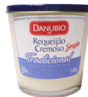
Copo Single requeijão Danúbio