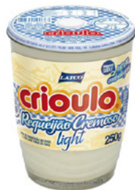
Copo requeijão Crioulo