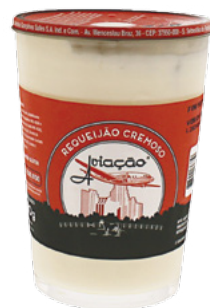
Copo requeijão Aviação