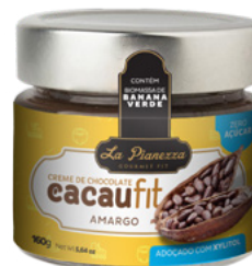
Creme La Pianezza