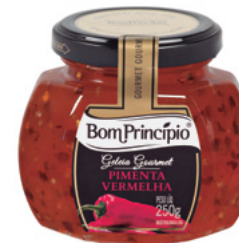
Geleia Bom Princípio