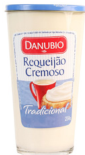
Copo requeijão Danúbio